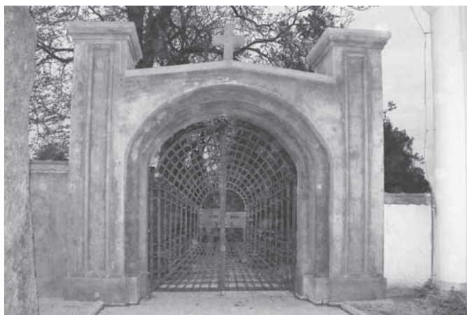
A tak vypadá v současnosti.