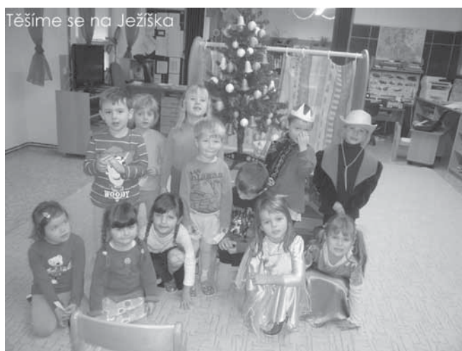
Těšíme se na Ježíška