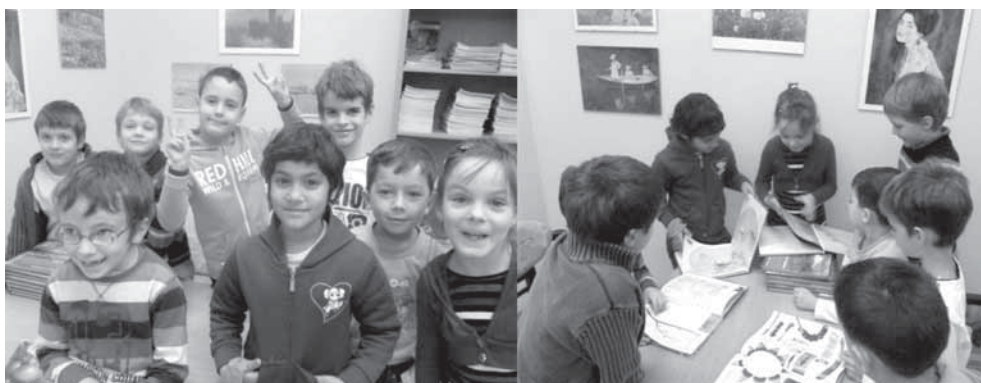
Návštěva prvňáčků v knihovně seznámení s knižními novinkami - 21.11.2012