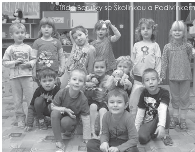
Třída Berušky se Školínkou a Podivínkem