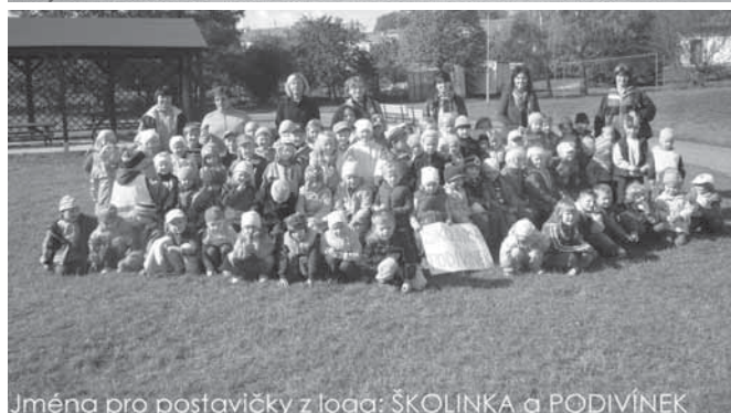
Jména pro postavičky z loga: ŠKOLINKA a PODIVÍNEK