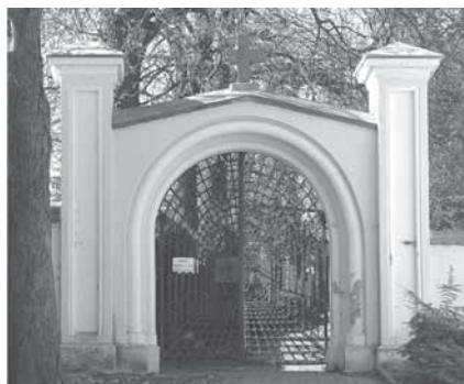
Tak vypadala před rekonstrukcí.