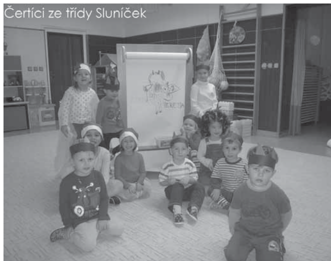
Čertíci ze třídy Sluníček