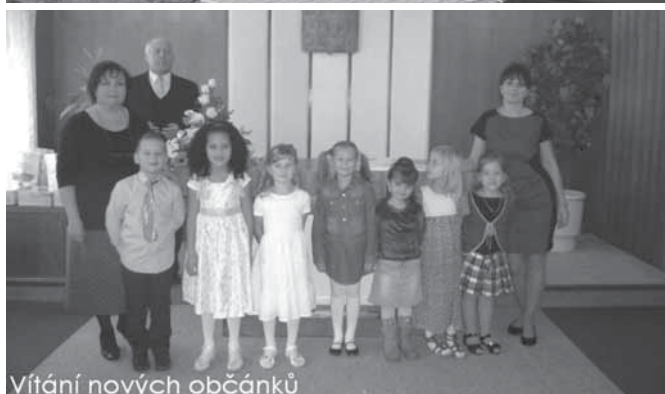
Vítání nových občánků