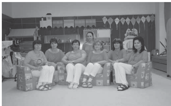
Přejeme krásné Vánoce a hodně zdraví v roce 2013