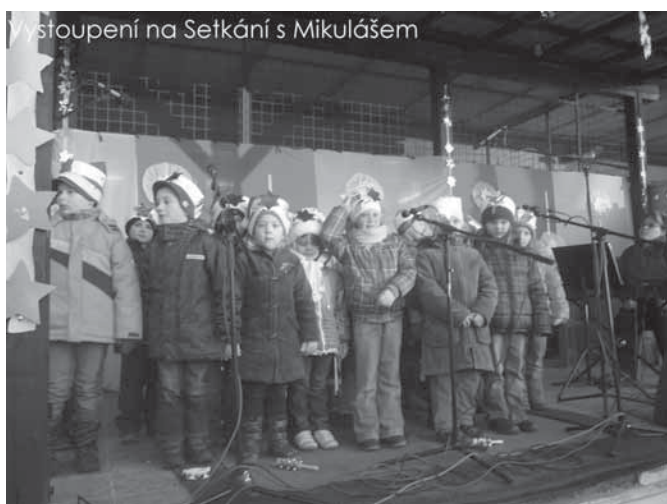
Vystoupení na Setkání s Mikulášem